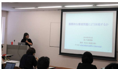
著名な講師による講義

卒塾生は、塾で学んだ環境に関する知識を生かし、職場改善や地域での環境活動に取り組んでいます。また、塾生同士、アドバイザー講師、卒塾生、講師とのネットワークが築かれるのも「塾」の目的であり、そのネットワークが卒塾後の活動に生かされています。卒塾生や地域社会を創る人たちの活動の場として、卒塾生等が中心となりNPO法人AKJ環境総合研究所を設立し、2014年度から活動しています。