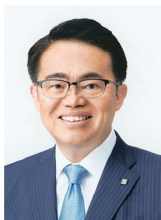
愛知県知事 大村 秀章

経済活動や日常生活による環境への負荷の増大や天然資源の枯渇などが懸念される今日、社会全体の仕組みを見直し、持続可能な社会を形成していくことが私たちの重要な課題となっています。