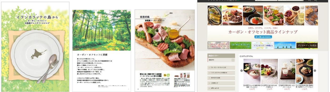
(左から) カタログ表紙イメージ、取組紹介ページ、掲載商品例、ウェブサイトイメージ