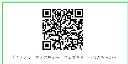
「イランカラプテの島から」ウェブサイトへはこちらから