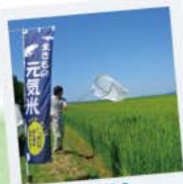
えらぼう 石川県の河北潟湖沼研究所