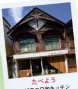
たべよう 宮城県の日和キッチン