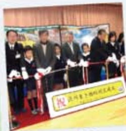
つたえよう 滋賀県の流川いきものがたり作風支援委員会