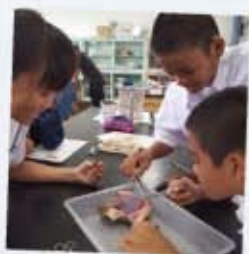
ふれよう 沖縄県の石垣市立伊原間中学校