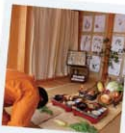
まもろう 石川県のまるやま組