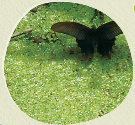
菅田池のクロアゲハ

開催日時 : 平成 26 年 9 月 27 日(土) 10:00~15:30 (9:50 集合)